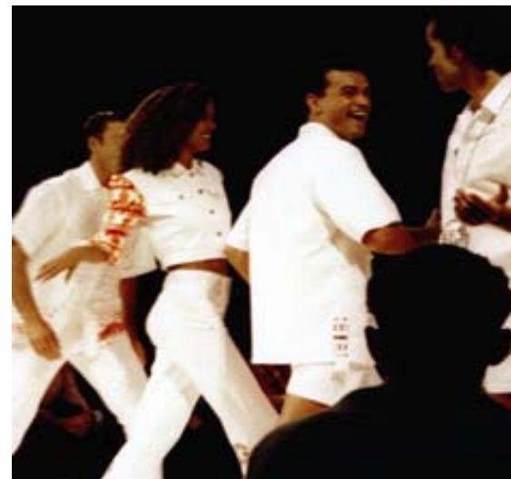
COLECCIÓN DE JEANS WEAR CON APLICACIONE DE ÑANDUTIES DEL PARAGUAY EN LA PASARELA DEL AVANT GARDE DE COLONIA, ALEMANIA