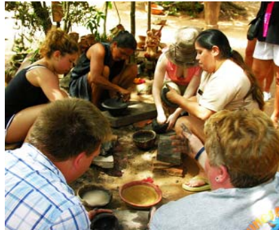
Maestra artesana y participantes de los programas de turismo social de