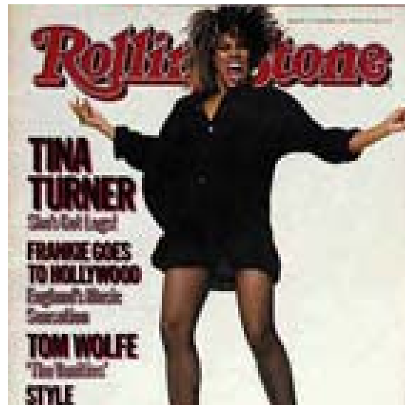
TINA TURNER DURANTE UN CONCIERTO EN ALEMANIA, VISTIENDO UNA CAMISA DE AO POI BORDADO DEL PARAGUAY