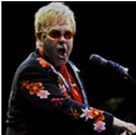
ELTON JOHN DURANTE UN CONCIERTO LUCE SACO, CON APLICACIONES DE HUIPILES DEL ALTIPLANO DE GUATEMALA