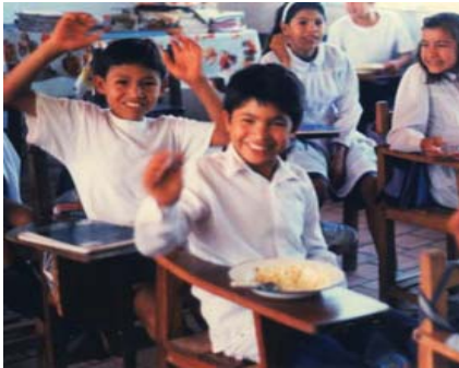
Hijos de artesanos beneficiados Por el programa de alimentación