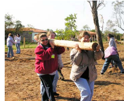
Voluntarios de Paraguay Hecho a Mano, ayudan a construir una